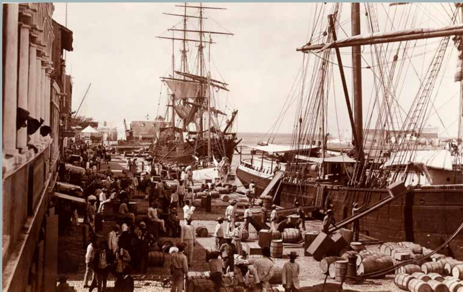
DE HANDELSKADE, WILLEMSTAD, CURAÇAO (1885-1890,).